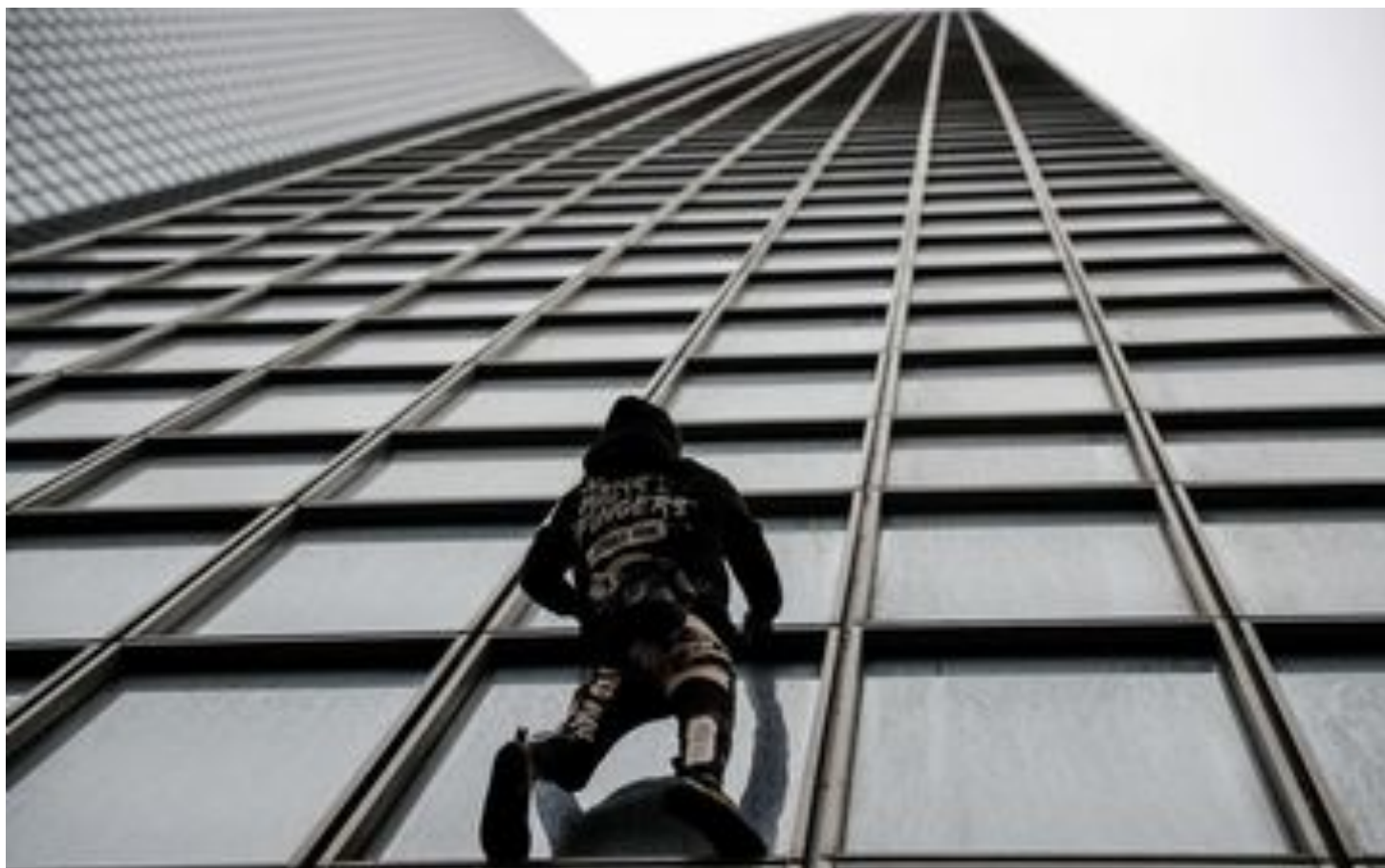
Réforme des retraites : le grimpeur Alain Robert escalade la tour Total en soutien aux grévistes